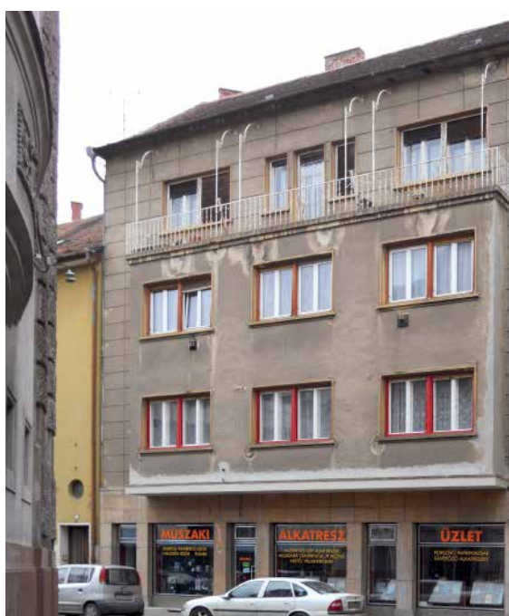
Szombathelyi bérház: Mártírok tere 6/A.,