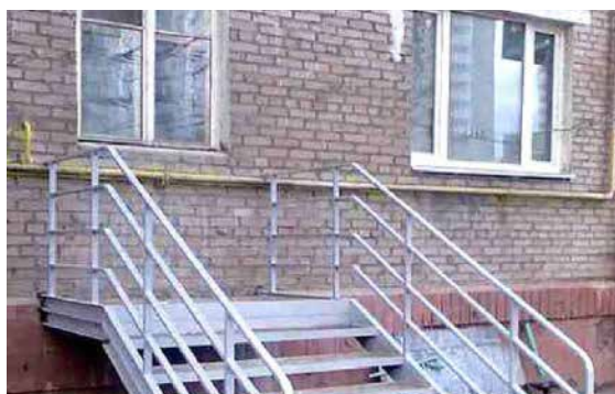
Ha megjön a férjem...