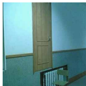
Egy méterrel a föld felett