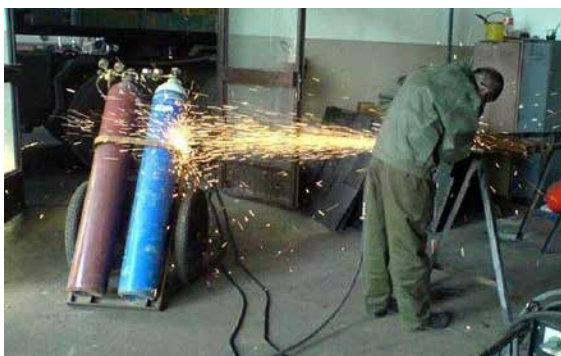
Kiköszöröljük a csorbát