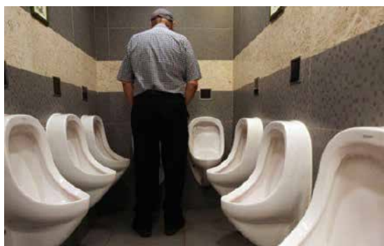
Minden napra egy...