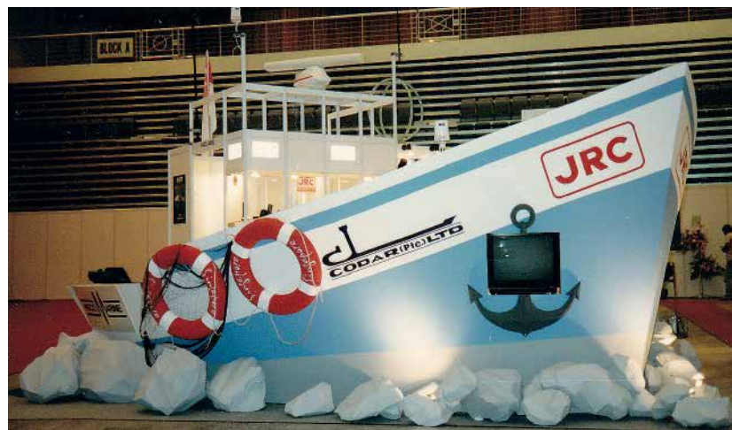
Stand egy szingapúri kiállításon

Az interaktivitás. A diákok azonnal észreveszik, ha melleszélek, vagy pontatlan vagyok. Mindig elmondom nekik, hogy nem kell elhinni semmit: én arról beszélek, amit én gondolok, az ő személyes felelősségük, hogy eldöntsék, mit fogadnak el ebből. Ezt csak nyílt szívvel lehet csinálni. Mint, ahogy minden mást.