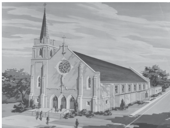
A Lafayette-i Szt. Bonaventura templom

Néhány szombathelyi munkája: családi házak: Jókai u. 2., Kunoss E. u. 2., Báthori I. u. 2., Újvári Ede u. 8., Malom u. 12.; bérházak: Malom u. 16., Mártírok tere 6/A., Wesselényi u. 8-10.; Főplébánia, Széchenyi u. 8., Szeminárium bővítés, Szily J. u. 3.