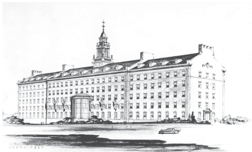
A Johnson and Johnson cég irodaháza New Brunswickban