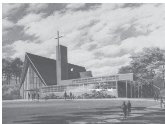
A metodisták temploma Wesley-ben

Szombathelyen kezdett el dolgozni a Kopfensteiner (később Kőteleki) cégnél. Egy idő után önálló irodát nyitott, 1931-ben a Mérnöki Kamarának is tagja lett. Több családi és bérházat tervezett – főleg középosztálybelieknek –, de kapott egyházi megbízásokat is, mint például a herényi vagy a nemesbódi rk. templom bővítése. 1937-ben Grósz püspök kinevezte a szombathelyi egyházmegye építészévé. Ebben a minőségében tervezte a főplébánia barokk épületének emeletráépítését 1938-ban, valamint a szeminárium kibővítését 1937-ben. Ez utóbbi volt talán a legjelentősebb munkája itthon, ugyanis összekapcsolódott a Romkert feltárással, ami miatt a tervet többször