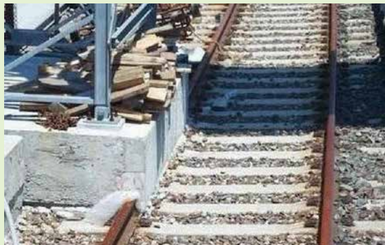
Ha elindul a vonat...