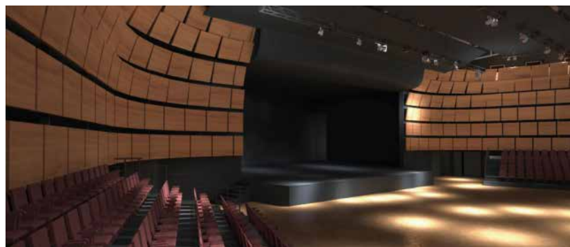
Látványterv a nagyteremről

lülete négyféle akusztikus táblából van összeállítva. A színháztechnológiai berendezések új elemekkel bővülnek: süllyeszthető zenekari árok, oldalról kihúzható tribünök, világítási hidak nyújtanak tágabb teret a rendezők fantáziájának. A nagyterem belül megoldást adtunk egy kamaraterem mobil válaszfalakkal történő lehatárolására is. Természetesen az épületgépészeti és villamos rendszerek teljes cseréje is megtörténik a rekonstrukció során. A külső bővítések – kis méretük ellenére – lehetőséget nyújtanak a délnyugati oldalon az előcsarnok, ill. agora tér háttérét adó új homlokzati felületre. Ez a felület – az esti díszvilágítással – az épület szignáljaként szolgál, nappal pedig ellátja az égtáj szerint szükséges árnyékolást. Szerkezete acélvázra feszített színes terpesztett alumíniumlemez. Jelenleg a terv kivitelezése folyik. Ezzel kapcsolatban van egy rossz és egy jó hírem. A rossz hír az, hogy a támogatás és a város önerejének összege csak az épület kétharmadának megújítására volt elég, a színpad és az üzemi szárny rekonstrukciójára csak egy későbbi ütemben kerülhet sor. A jó hír, hogy a munka valamennyi résztvevője, kivitelezők, tervezők és műszaki ellenőrök azon dolgoznak, hogy a rekonstrukció végeredménye nyerve el a város lakosságának, az épület használóinak tetszését.