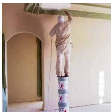
Ha kicsi a karod